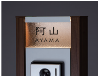
夜間点灯時イメージ