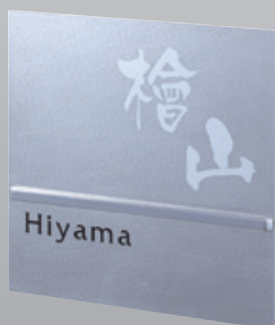
NUM-SV-21(2色) バイブレーション

漢字:なごみ体 ローマ字:フリッツ体(頭文字のみ大文字) 漢字:シルバー ローマ字:黒 150×150×14mm 約650g