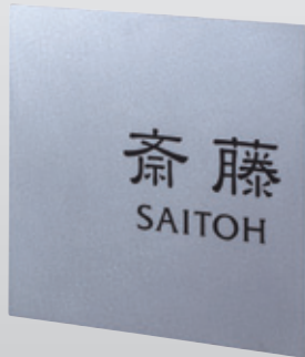
NUM-PV-25(黒) バイブレーション