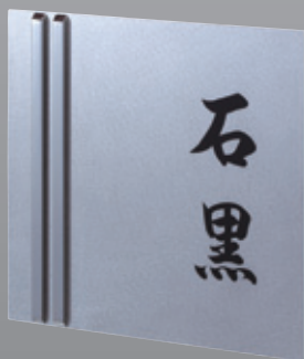
NUM-DV-23(黒) バイブレーション